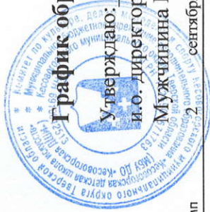
График образовательного процесса.