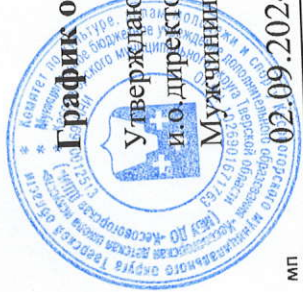
График образовательного процесса .